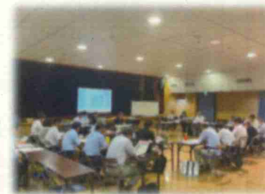
▲検討会の様子 (会場：御所見市民センター)

第5回検討会では、6月16日に開催されたまちづくり説明会や意見シートで寄せられた意見を踏まえ、まちづくりの方向性、方針（案）について更新し、決定しました。また、ゾーニングの検討における考え方について事務局から説明がありました。 ※更新されたまちづくりの方向性、方針（案）は見開き2～3ページをご覧ください。