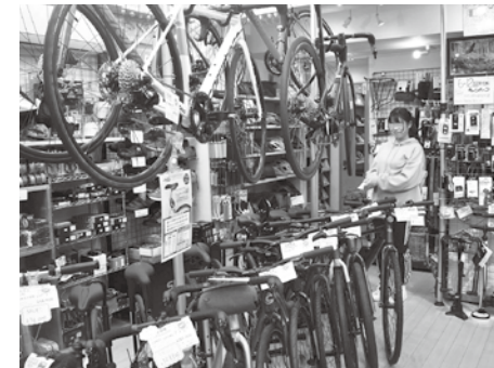
職人版インターンシップ (技能職職場体験講習)