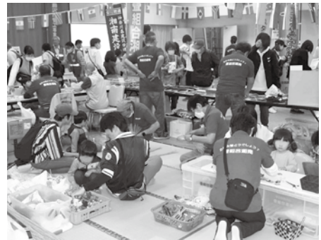
技能まつり (藤沢産業フェスタ)