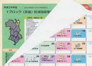
区域別収集日程カレンダー

資源品目別戸別収集開始に伴い、収集日が変更になります。詳しくは、平成24年3月頃配布いたします「区域別収集日程カレンダー」でご確認ください。