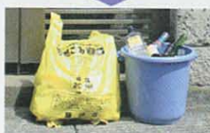
※写真は、排出例(以下同)