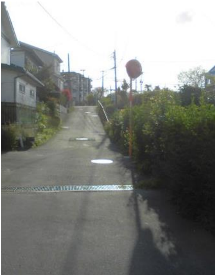
【東側】 現況幅員約 4.0mの舗装市道