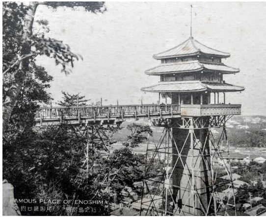
AMOUS PLACE OF ENOSHIMA 江の島龍口園

この連載では、昭和という時代のはじまりに、聖なる山が子供たちの楽園として輝いた一瞬の軌跡をよみがえらせてみたい。