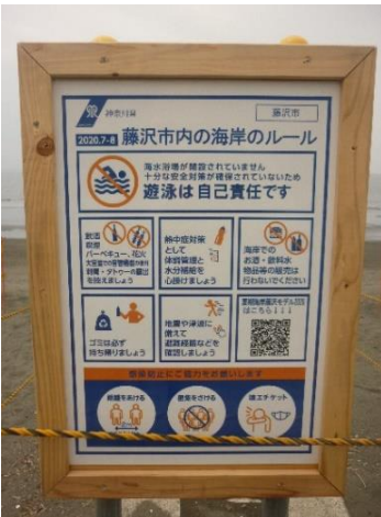
海岸の各所に立てられた看板

7月半ばからは、神奈川県ライフセイビング協会から派遣された「ライフセーバー」により、マナーアップや利用者の安全監視・指導が行われました。また、新しい試みとしてドローンによる監視・パトロールが土日祝日を基本とした、日中1時間おきに行われました。