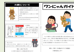
↑ワンにゃんガイド 市民センターで配布中！

戸配布しました。 そして本ワーキングは挙げられた課題について検討及び活動を全て行ったとの結論に達したため、28年度をもって活動を終了しました。