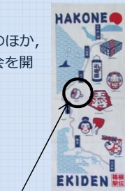
箱根駅伝にも登場！