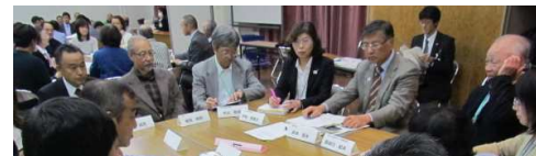
地区集会所での活発な意見交換の様子

協議会では、13のまちづくり事業と2つの地域課題を部会や課題別検討ワーキングの委員と協力員を中心に進めてきました。また、28年度は地区集会所を2回行い、皆さまとの意見交換を行いました。