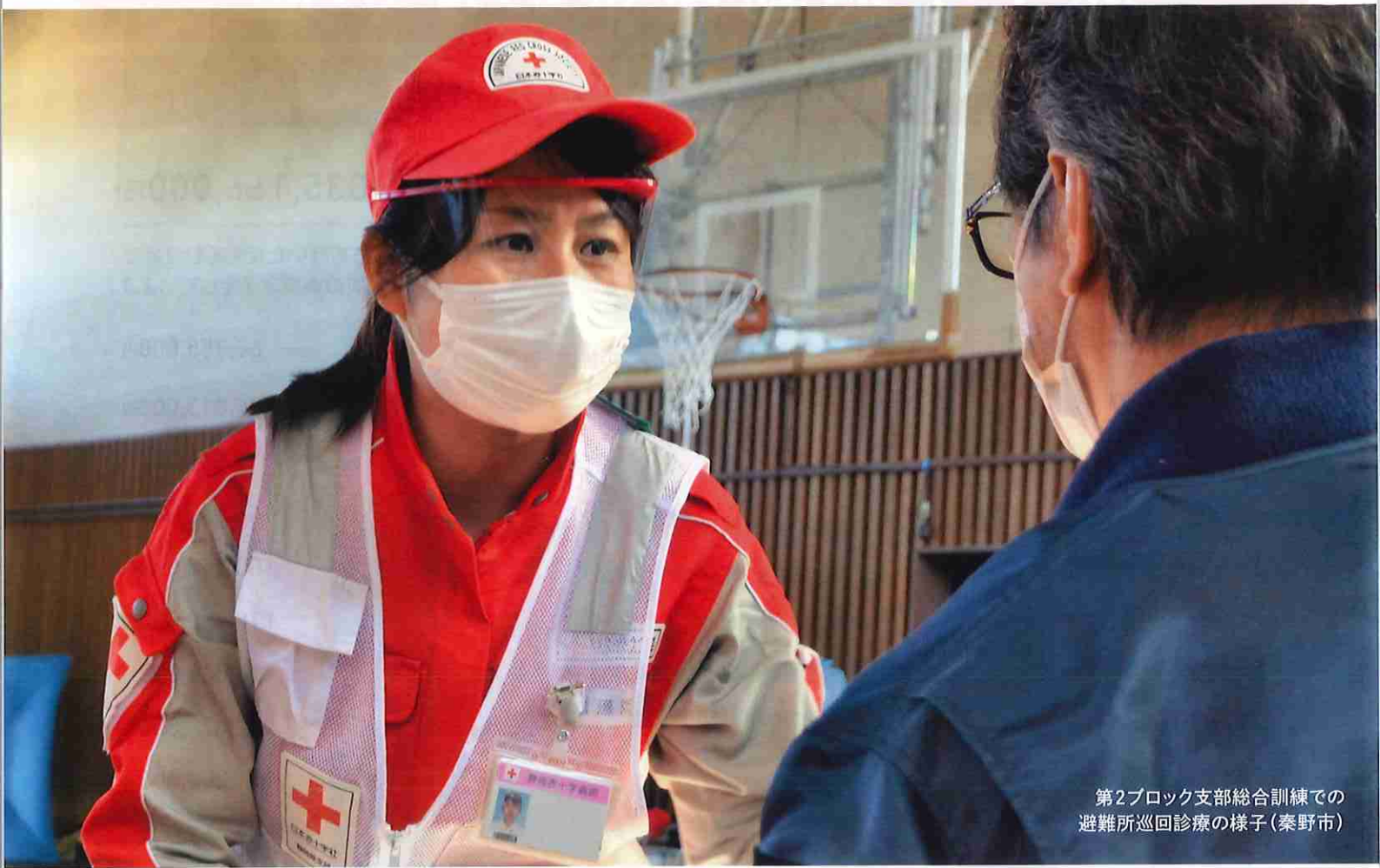
第2ブロック支部総合訓練での 避難所巡回診療の様子(秦野市)