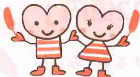
藤沢市社協キャラクター たーすけくん&あいちゃん