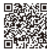
ふじさわ宿交流館 ホームページ