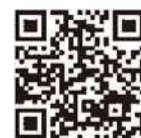
認証キーの取得方法 発注者への提出方法