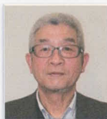
かながわ東北・ふるさとつなぐ会

それぞれの想いや考えがあると思いますが、私達は昨年地域を超えた避難当事者中心の『つなぐ会』を発足させました。現在47世帯・75名の会員でバスハイク、寄り合い等の交流会を通じ情報交換しています。今年度も『あゆむ会』との連携で親しく楽しめる企画を予定しています。立場の同じお知り合いの方大歓迎です。よろしくお願いたします。