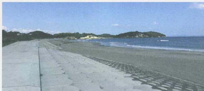
今年フルオープンとなった菖蒲田海水浴場(七ヶ浜町)