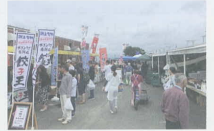
▲関上港朝市（名取市）

毎月更新の「復興の進捗状況」は、県ホームページでご覧いただけます。 http://www.pref.miyagi.jp/site/ej-earthquake/shintyoku.html