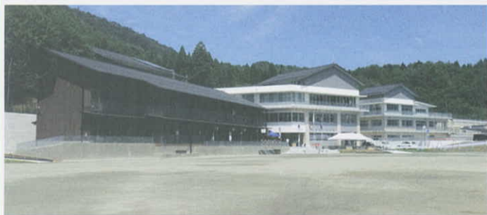
石巻市立雄勝小学校・雄勝中学校が完成(石巻市)