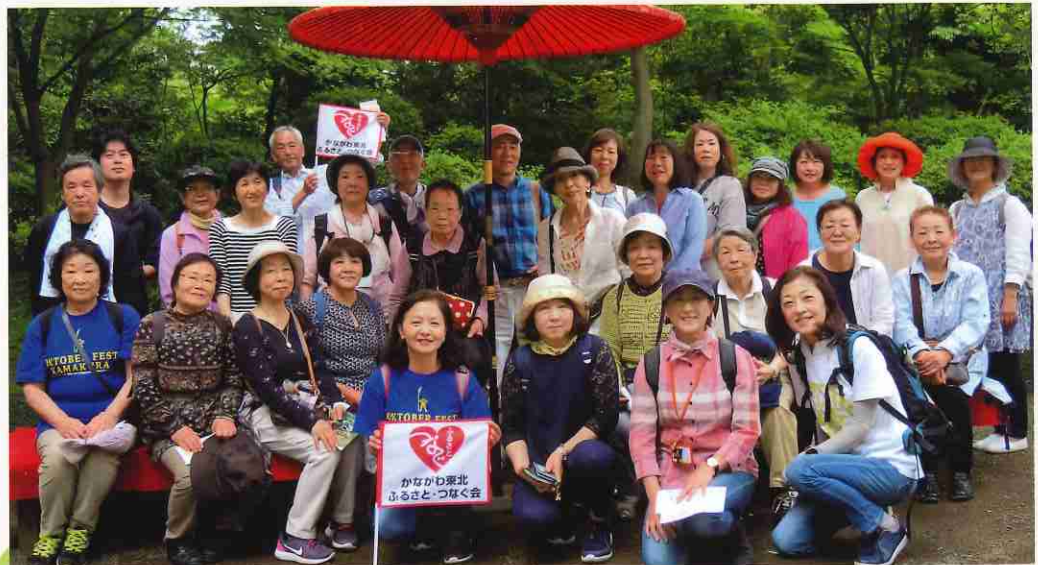
六義園で皆さんとハイ、チーズ!