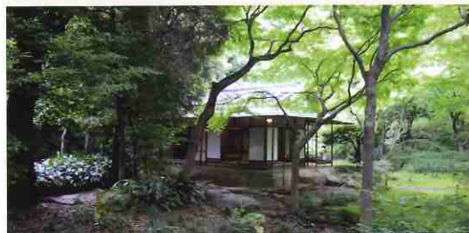
関東では珍しい崩石積(くずれいしづみ)と庭門で仕切られた茶庭にある茶室。

この旧古河庭園は、鹿鳴館、ニコライ堂などを手掛けた英国人建築家ジョサイア・コンドルによるものです。石造りの洋館に続くバラ園は満開で各種のバラが咲き乱れていました。(イヤーんだげんちょも土曜日だからって、人が多すぎっぺ。やっぱ都会は違うなあー)