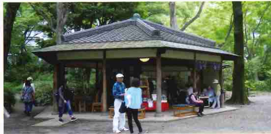
六義園のつつじ茶屋は、ツツジの古木材を用いて建てられ、戦災を免れた貴重な茶屋。