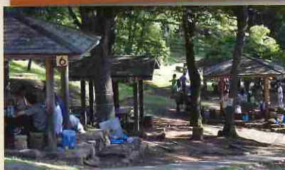
BBQの予約はネットから。手ぶら、持ち込みOK。

【入園料】無料。BBQ・教室は有料。【アクセス】小田急小田原線本厚木駅~バスで「森の里」行、「森の里三丁目」下車徒歩7分。駐車場は土日祝有料。北口駐車場は通年無料。【住所】厚木市七沢901-1