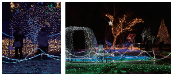
コダナリエのイルミネーション