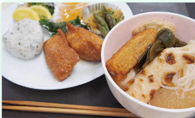
「あすと食堂」の料理は住民の得意料理が並びます。この日のメインはおでん。約30食があったという間に売り切れました。