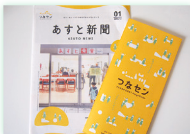
年4回発行の「あすと新聞」やFacebookなどで、活動の様子を情報発信している

づくりを多数企画。まちあるきイベント、ふらりと立ち寄れるカフェ、音楽好きな人が思わず立ち寄りたくなる演奏会など、一人でも参加しやすく、人々の幅広いニーズに応えられるようなきめ細かさが重視されているのが特徴です。参加者も支援者もさらなる多様化をすることで、誰もが交流する機会をもつコミュニティの実現を目指しています。