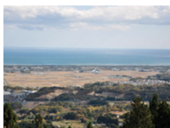
(深山山頂から町内を望む)

太平洋に接し、宮城県の東南端に位置する山元町、津波により町の37%以上が水没し、600名以上の命が失われました。太平洋沿いにある常磐線も津波に襲われ、町内の坂元駅も全壊しました。 震災から5年を経た平成28年12月、山元町を走る常磐線は線路を内陸に移して再開し、新しい町の形が生まれ始めています。