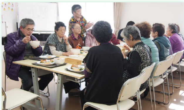
支援される側、する側の垣根を感じないようなイベントにしていきたいという「あすと食堂」。

地域と人をつなぎ、楽しみながら支えあう仕組みづくり (特定非営利活動法人つながりデザインセンター・あすと長町)