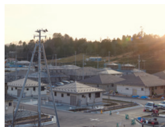
整備を進める災害公営住宅