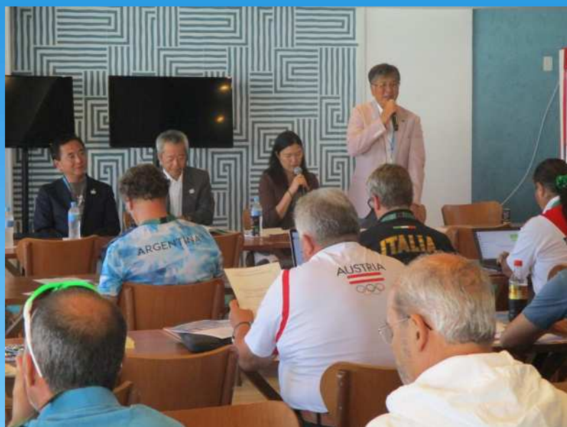
鈴木市長からの プレゼンテーション