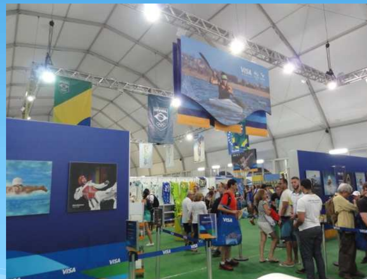
メガストアの状況