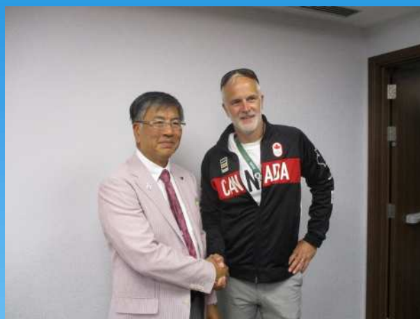
カナダオリンピック委員会