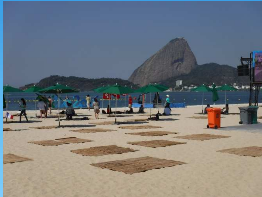
レース前の観客席の様子