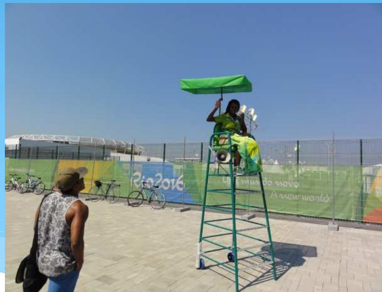
大会ボランティア (会場内案内スタッフ)