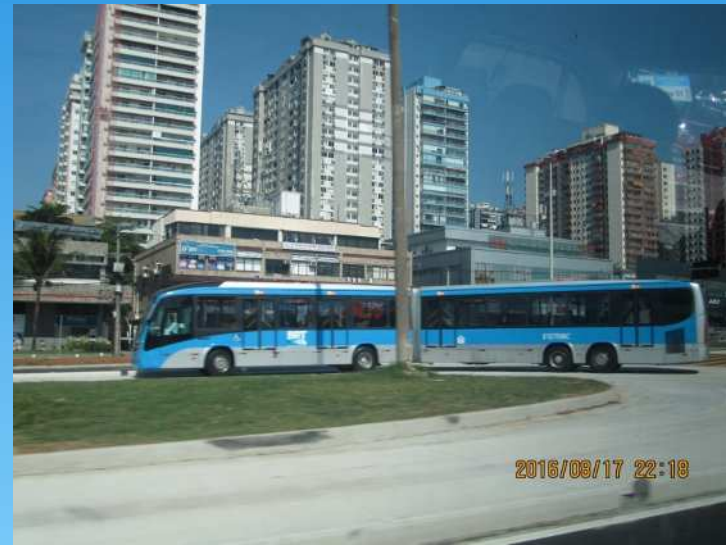
BRT (バス高速輸送システム)

BRTは、地下鉄駅とオリンピック会場を結ぶ交通機関である。 よって、観戦チケットを持っている人のみ、乗車が可能となる。 (セーリング会場にはBRTは運行していない)