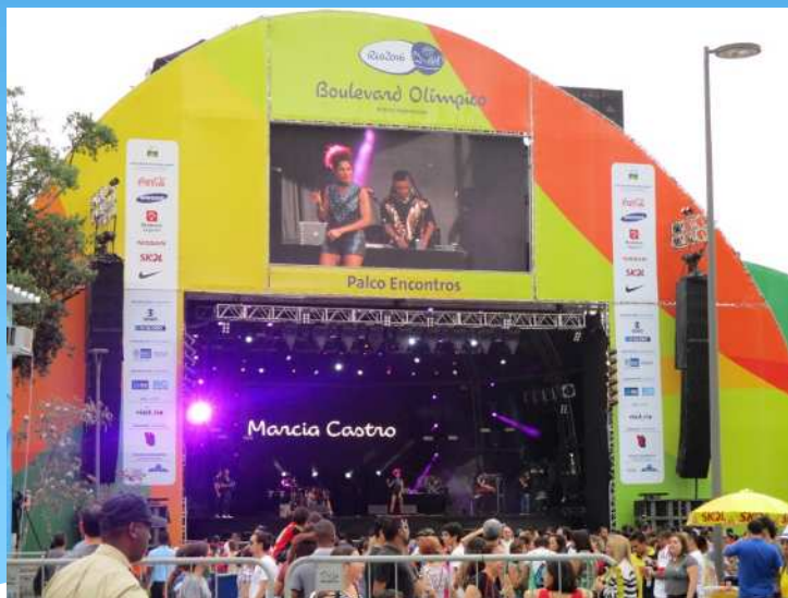
市内のパブリック ビューイングの状況

市内には、パブリックビューイングを観戦する方やメガストア(オフィシャルショップ)で買い物する方が多数いた。