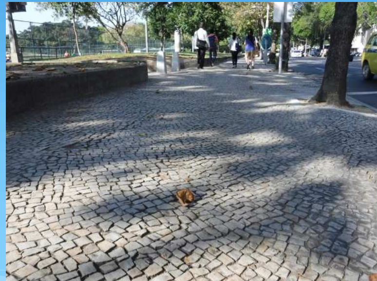
セーリング競技会場近くの 歩行者通路