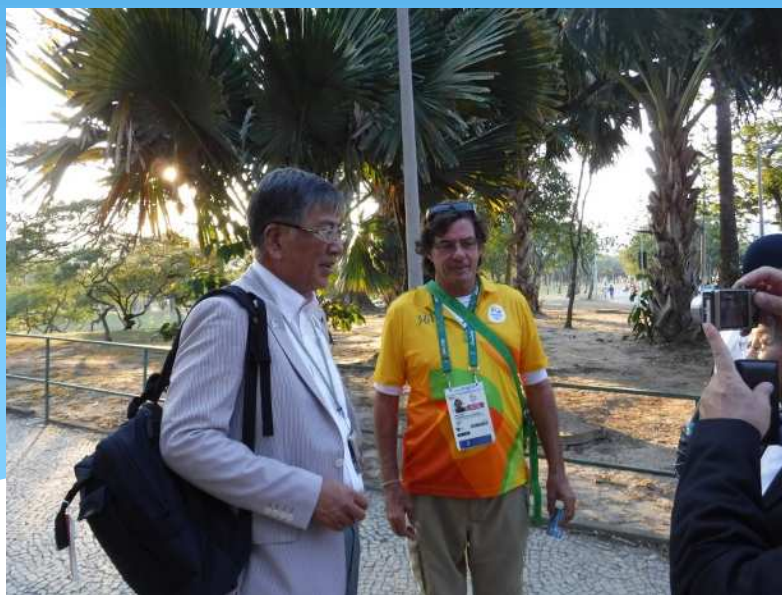
大会ボランティア (運営スタッフ)

「 大会ボランティア 」は黄色・黄緑・赤・水色のポロシャツ、「 都市ボランティア 」は濃紺のポロシャツを着用し、一目でボランティアであることが判別できた。