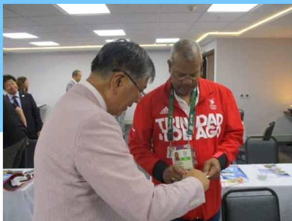
トリニダード・トバゴ陸上競技連盟