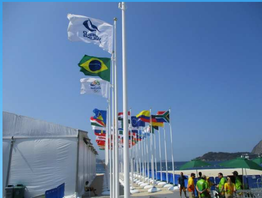
参加国の国旗 (今回は66カ国が参加)