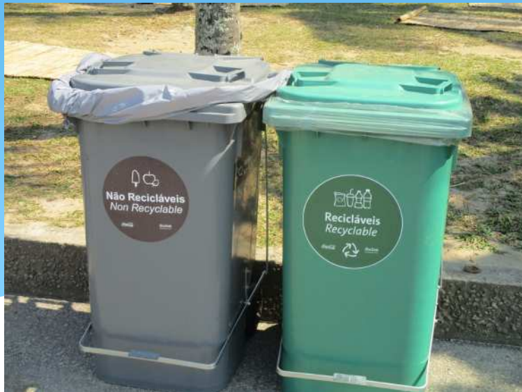
セーリング競技会場内のごみ箱