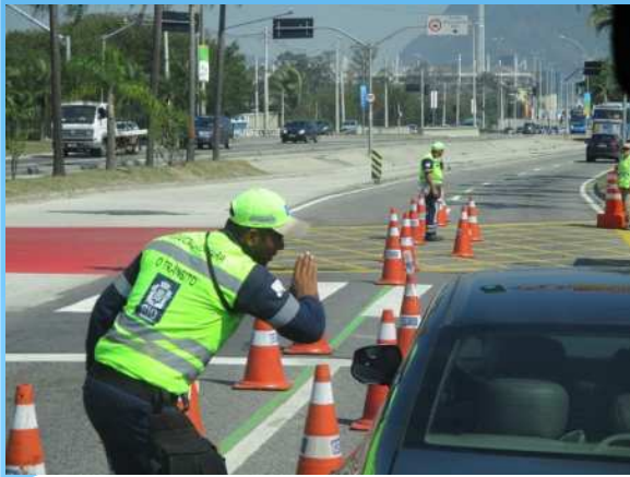
交通規制状況 (警備員による検問)

選手役員等大会関係者への対応として、オリンピックレーンが設置され、専用車線(実線で区画)・優先車線(点線で区画)となっていた。また、一般車道については、期間中、交通規制が実施されていた。