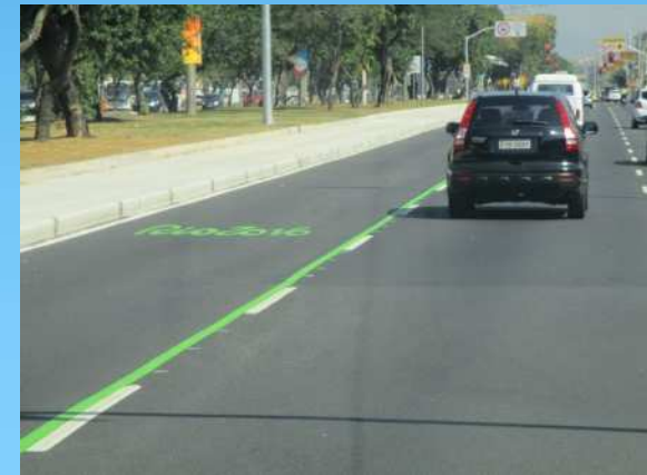
オリンピックレーン 「RIO2016」と道路に ペイントされている。