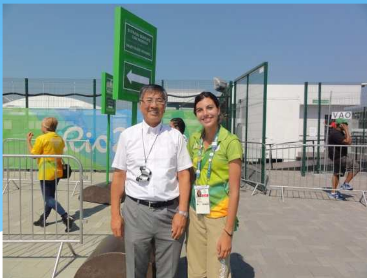
大会ボランティア

ボランティアは、大会組織委員会が管理・運営する「 大会ボランティア 」と開催都市が管理・運営する「 都市ボランティア 」の2種類の体制がある。