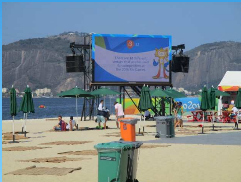
観客席前の 大型ビジョン