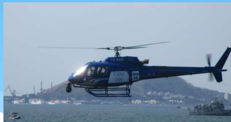
撮影用ヘリコプター