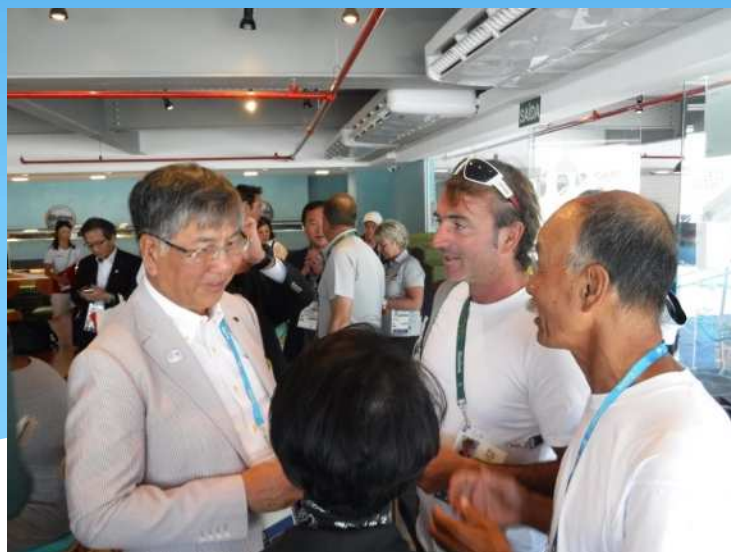
ノルウェーコーチとの意見交換

毎年、江の島においてノルウェーフレンドシップレースが開催されていることから、ノルウェー国セーリングチームコーチのANTON GARROTE(アントン・ガロッテ)氏と、4年後に向けての意見交換を行った。