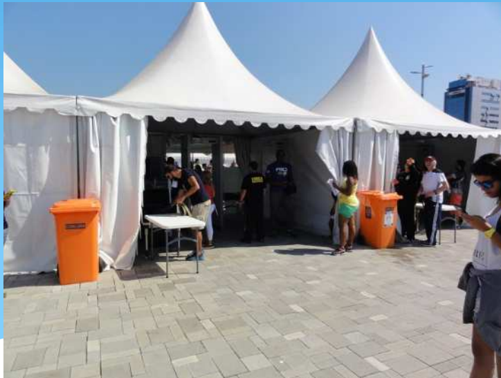
セーリング競技会場入場ゲート

セーリング競技会場内への進入は、入り口で軍関係者による金属探知と荷物検査が行われ、その次にチケットの確認が行われていた。