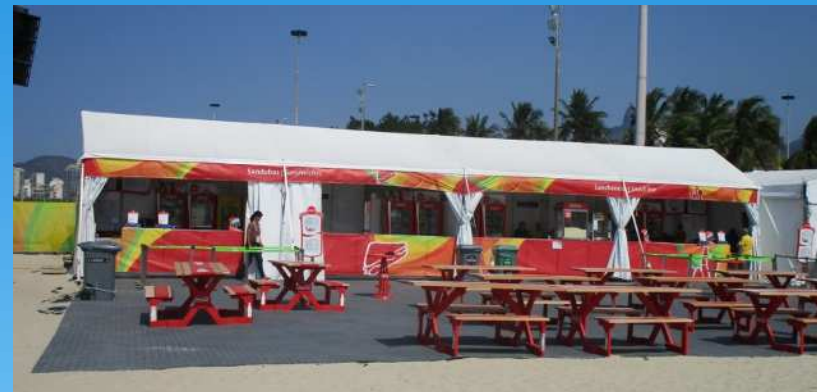
観客席横の物販店舗