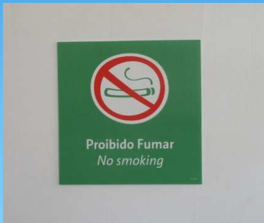
屋内が禁煙であることを示す看板