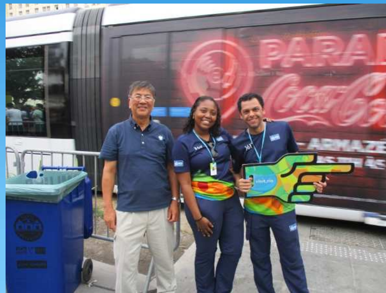
都市ボランティア (交通案内)

会場の1マイル(約1.6 km)手前から、およそ100mごとにボランティアを配置していた。