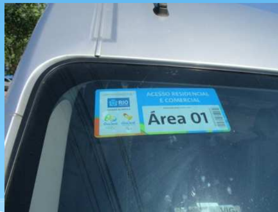
会場周辺住民には許可証の シールを張り付けていた