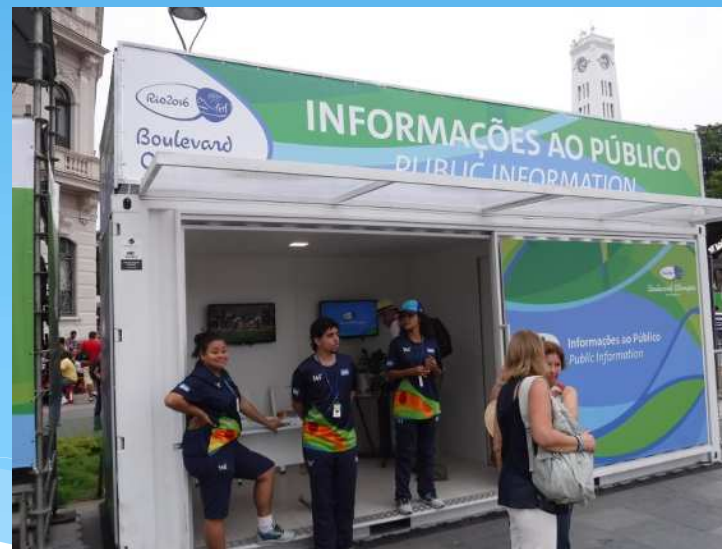
都市ボランティア