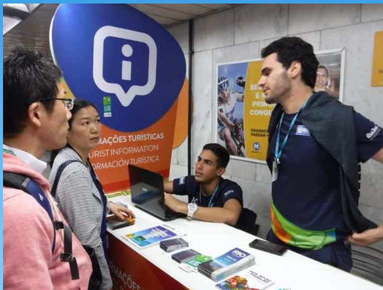
都市ボランティア (セーリング競技会場最寄駅 「Catete(カテテ)駅」での案内)