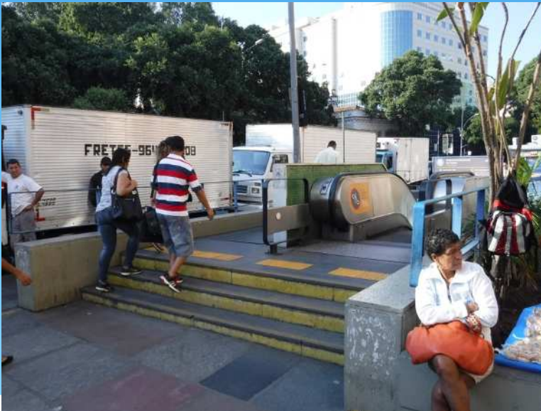
セーリング競技会場に向かう 歩行者通路上の階段

セーリング競技会場までの通路や歩行空間には、階段や段差などがあり、車いす等での通行が困難なところがあった。