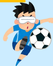
ブラインドサッカー®