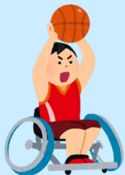
車いすバスケット