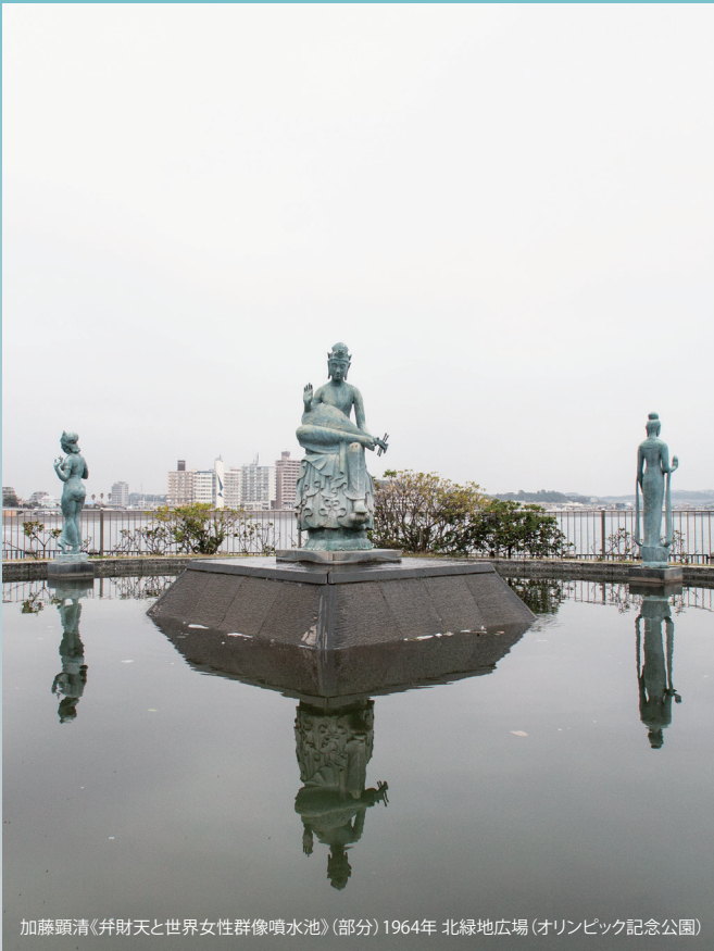
加藤顕清《并財天と世界女性群像噴水池》(部分) 1964年 北緑地広場(オリンピック記念公園)

市内に点在する既存のパブリックアートの新たな表情を発見、さらにはなぜか気になる不思議なオブジェやまちの風景をニュー・パブリックアートとして発表します。