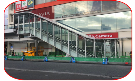
ビックカメラ前エスカレーター