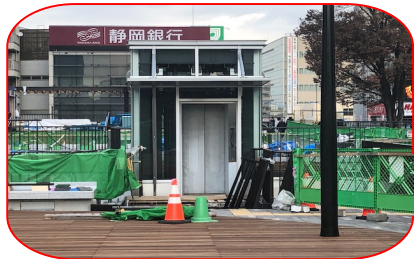
バスロータリー中央エレベーター