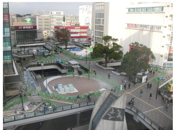
上空から見たペDESTリアンデッキ（11月撮影）