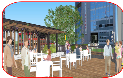
ガーデンテラス (ウッドデッキ・藤棚)