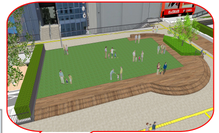
ガーデンパーク(人工芝) ●式典会場●