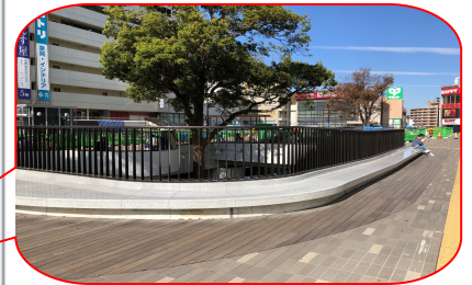
ベンチ及び多柵高欄