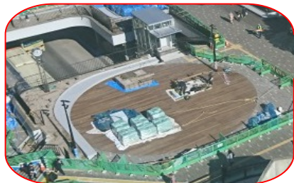
待ち合わせ広場(ウッドデッキ・時計塔)