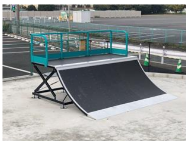
クォーターランプ (幅3.6m・奥行3.2m)