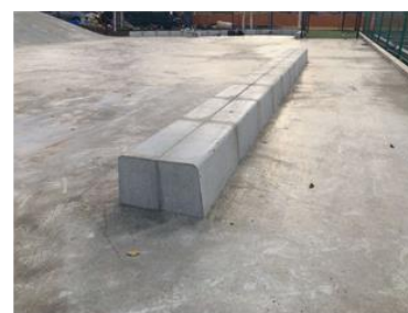
カーブボックス (長さ6.0m)