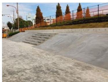
コンクリートバンクセクション (高さ1.2m)