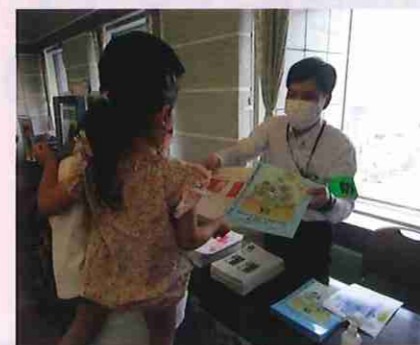
イベントでも配布し、お子さんに大人気です!

県警では、お子さんが、楽しく防犯について学べる「子ども警察手帳」を作りました! 「おおだこポリス4つのおやくそく」などのカードも入り、連れ去り防止などについてお子さんと一緒に「作って遊べ、学べる」手帳です。ぜひダウンロードしてください。