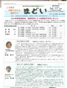
広報紙 → 「まどい」