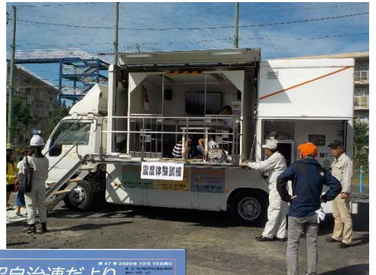
↑ 地区総合防災訓練