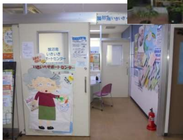
← 鵜沼南いきいき サポートセンター TEL 33-1166