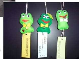
交通安全マスコット →