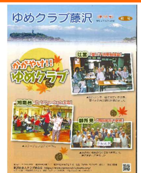
広報紙「ゆめクラブ藤沢」@市老連→