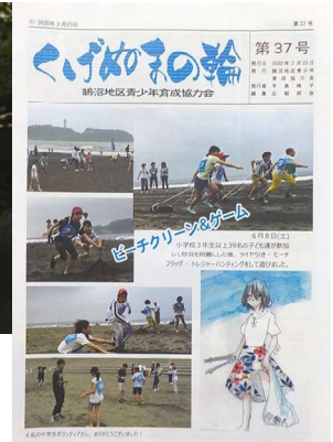
広報紙「くげぬまの輪」→