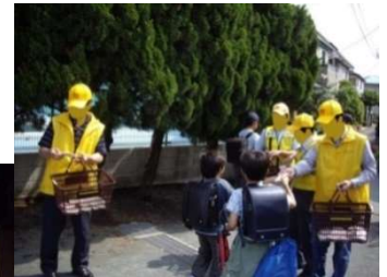
小学校下校時 安全活動 →