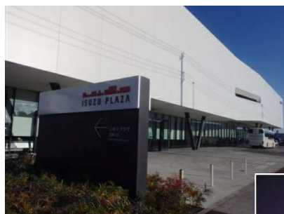
← 視察研修会 (動く交通安全教室) @いすゞプラザ