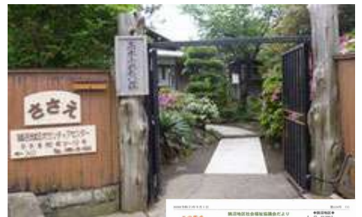
↑ ボランティアセンター 「ささえ」 TEL 36-6545