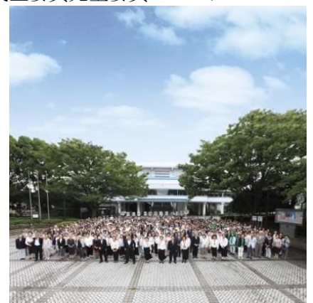
↑ 民生委員100周年記念式典