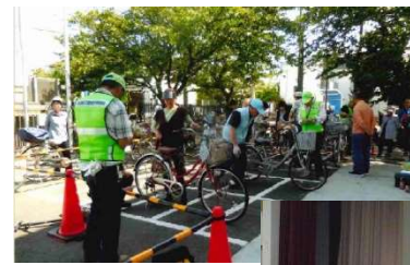
←自転車 街頭指導と 安全点検