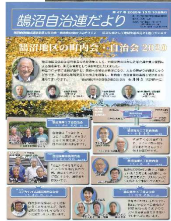
← 鶺鴒自治連だより