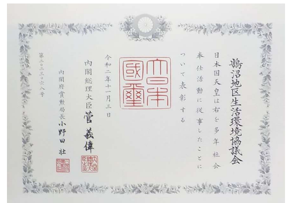
↑ 令和2年度秋 緑綬褒章を受章