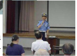
高齢者交通 安全教室→