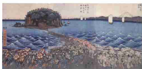
歌川広重「相州江之嶋弁才天開帳参詣群集之図」