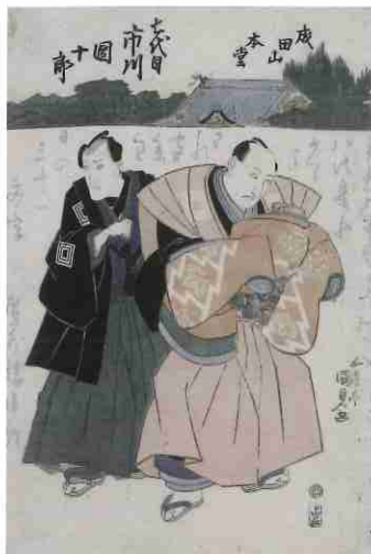
歌川国貞（三代豊国） 「題名不詳（七代目市川團十郎成田山参詣の図）」 船橋市西図書館所蔵