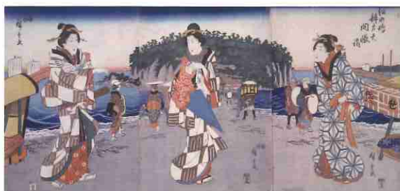
歌川広重「江の嶋弁才天開帳詣」 藤沢市教育委員会所蔵

江戸時代、多くの寺社仏閣による秘仏の御開帳などによって、信徒や一般の参詣客を取り込みながら、参詣ブームが起りました。弁財天信仰による藤沢市の「江の島詣」や千葉県成田山新勝寺の不動明王信仰による「成田詣」は、その代表的なものとして知られています。 本展では江の島の弁財天信仰と成田山の不動明王信仰を題材にした浮世絵と郷土資料を展示し、双方の祭神の特徴や信仰がどのように人々の間で広まったのかを紹介します。