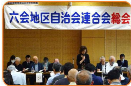
《事業及び予算計画案の公表》