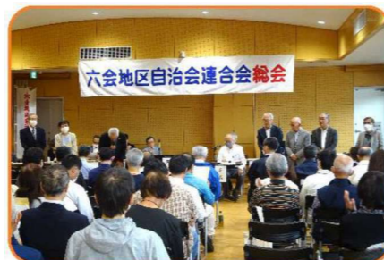
《自治会連合会の今年度役員の紹介》