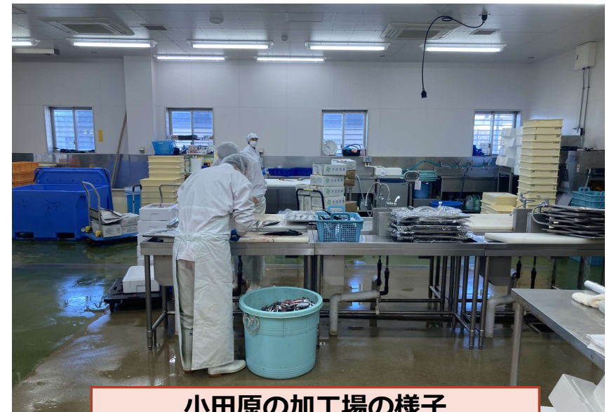
小田原の加工場の様子