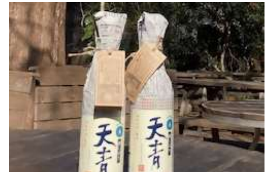
2月4日に販売された日本酒