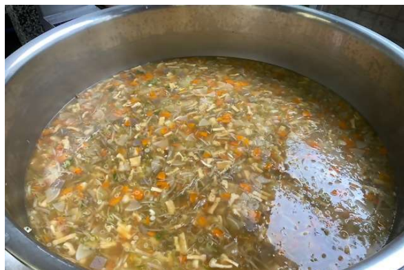
片瀬小学校で提供した給食