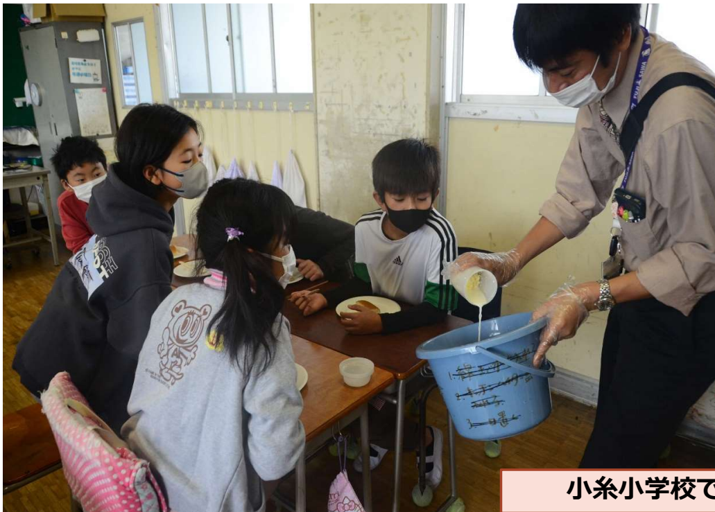
小糸小学校での授業の様子