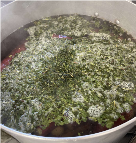
お茶でサツマイモを茹でる様子