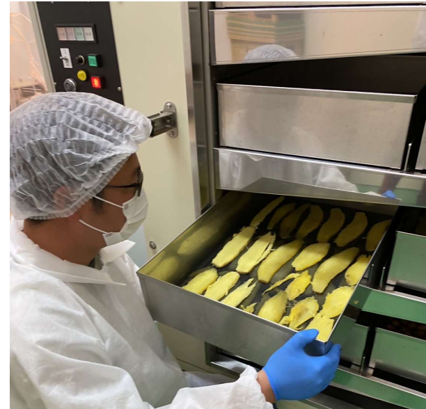
サツマイモを減圧乾燥する様子