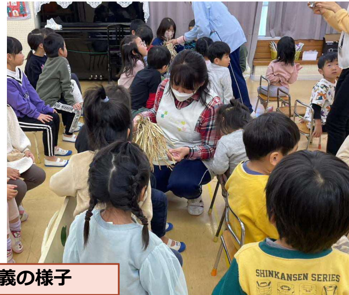
俣野保育園での講義の様子