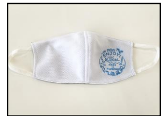
作成した地産地消ロゴマークが入ったマスク

みなと春まつりが中止となったため、その予算の一部を流用し、地産地消に関するロゴマークを入れたマスクを作成し、藤沢産サンセットマルシェ等において、藤沢産農水産物のPRチラシとあわせて配布し、地産地消及び藤沢産農水産物のPRを行った。