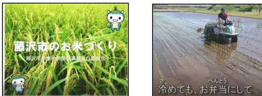
配信した動画の一部

※この動画は、(一社)JAバンクアグリ・エコサポート基金から一部映像の提供を受けているため、YouTubeにはドメイン設定を行い、教育委員会専用ポータルのみで視聴ができるよう制限をかけた。