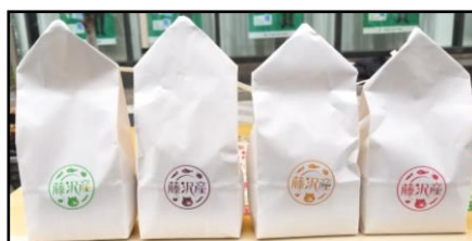
上段：当日の様子、下段：配布した新米はるみ