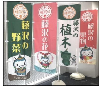
作成したのぼり旗