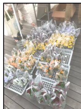
左：当日の様子、右：配布した花(ビオラ)