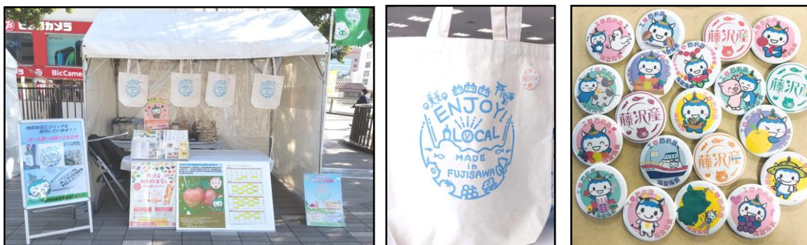
左：ふじさわ元気バザールでの販売の様子 中：作成したエコバッグ 右：エコバッグに付けた地産地消缶バッチ

※残ったエコバッグ408個については、令和3年度に開催されるイベントでの販売や地産地消講座の参加者に配付する予定