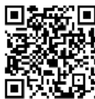
左：販売の様子、右：QRコード