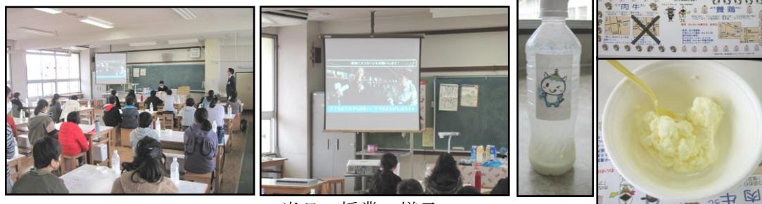
当日の授業の様子