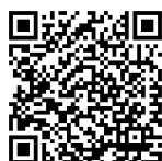
第2次藤沢市 都市農業振興基本計画