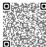
第5期藤沢市 地産地消推進計画