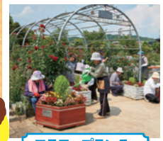
フラワープランター