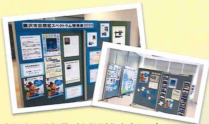
昨年度の啓発展（市役所分庁舎にて）