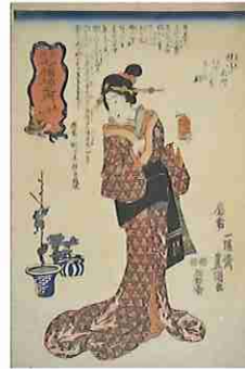
歌川国貞(三代豊国) 「誹諧七福神之内 毘沙門」