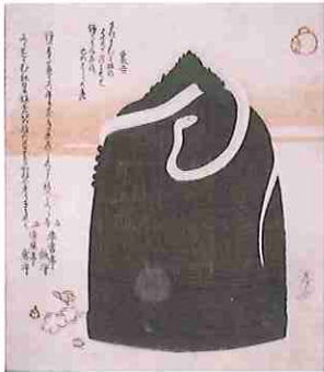
柳々居辰斎 「題名不詳(江の島弁財天鐘)」