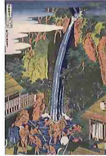
葛飾北斎 「諸国瀧廻り 相州大山ろうべんの滝」