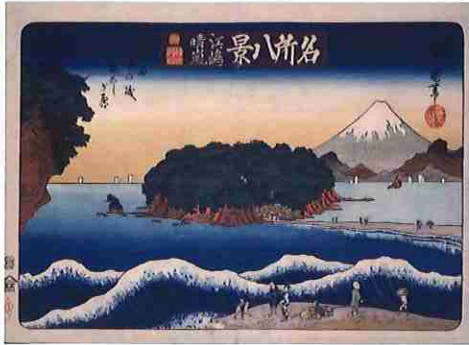
二代歌川豊国「名所八景 江ノ嶋晴嵐」