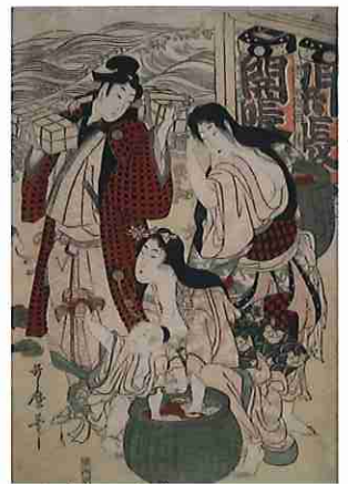
二代喜多川歌麿 「題名不詳 (江の島弁財天開帳)」