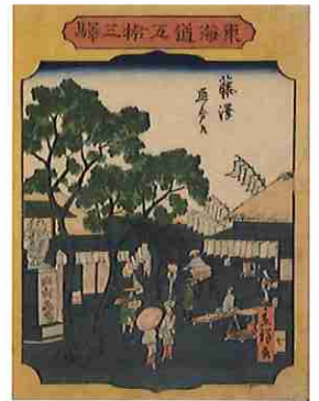
二代歌川広重 「東海道五拾三駅 藤沢 追分道」

浮世絵師の中には、著名な師匠の名を受け継ぎ、二代目、三代目を名乗って活躍した者が多くいました。二代目を襲名するという事は、歌舞伎役者と同様に、師匠の名声や技術を受け継ぐばかりでなく、さらなる飛躍が期待されることでもあります。